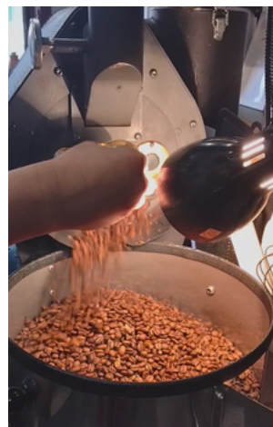
「コーヒー焙煎機」 自家焙煎している様子

Uターンしてよかったことは、人との出会いの他に、子育てがしやすいこと。家族で山や川に行くことが多く、こどもと一緒に自然に触れ合いながら伸び伸びと、楽しいひとときを過ごしている。