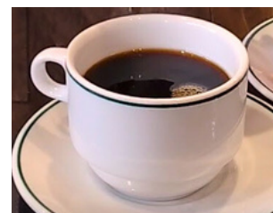
「ドリップコーヒー」 浅煎り～深煎りの中から選ぶことができる。

お店をやっていく上で大切にしていることは、何よりもお客様とのコミュニケーション。コーヒー豆は複数の産地から選ぶことができるため、お客様一人ひとりと対話をしながら、お客様の気分や好みに合わせたメニューを提供している。お客様の4~5割は常連のお客様で、全席常連のお客様で埋まることもあり、毎週ご来店されるお客様もいるという、たくさんの方々に愛されるお店だ。店内には、絵本やお子様用の椅子も用意されており、お子様連れにも嬉しい、誰もが気軽に入りやすい空間を作っている。