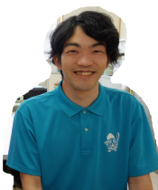
地域おこし協力隊 益子

大田原通信に掲載したい情報をお寄せください！地域のイベントや自治会での情報等、お待ちしております！