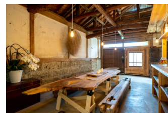
納屋を改装した食事スペース