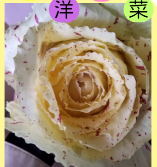
カステルフランコ