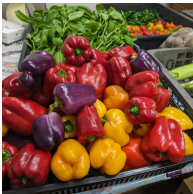
色鮮やかなパプリカ