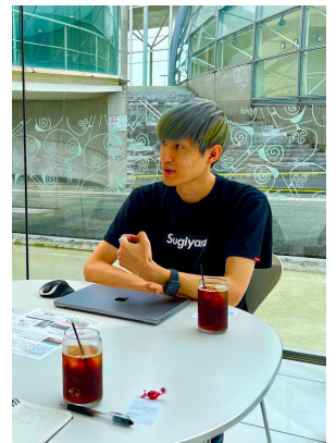
ハーモニーホール店にて

そんな学生時代を過ごす中で、将来は独立してコーヒー店をやると決め、経営の知識を勉強するべく飲食企業に就職されました。