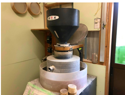
香りを大切にするため、蕎麦は打つ前に皮をむかないで石臼で挽く。