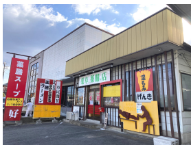
お昼は薬膳ラーメン、薬膳カレーも！