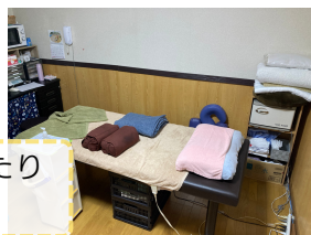
個室でゆったりリラックス