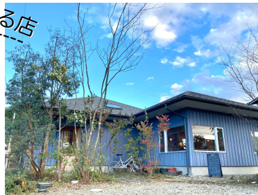
茶室に入っていくイメージで配置された植物たち