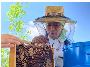
ミツバチが免疫力を高められるようにサポートしている。

「養蜂」と聞くと、ハチミツを取ることをイメージするかもしれないが、そうではない。